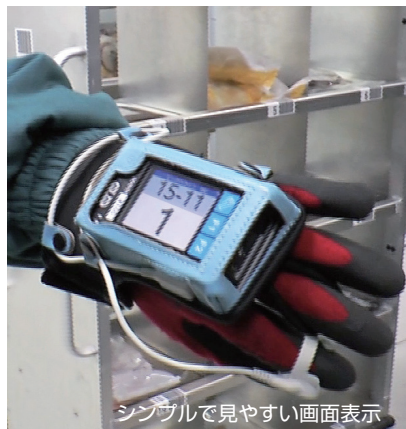
シンプルで見やすい画面表示