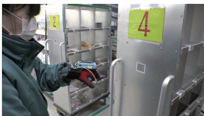
1 カートNoのバーコードをスキャン