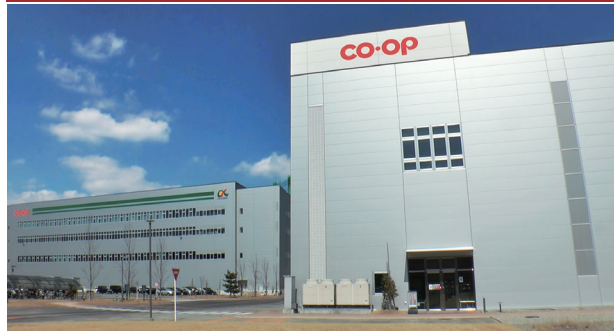
日本生協連 冷凍食品の取扱品目拡充にあたり 中国・四国エリアの拠点として稼働している尾道冷凍流通センター