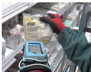
2 商品のJANコードをスキャン