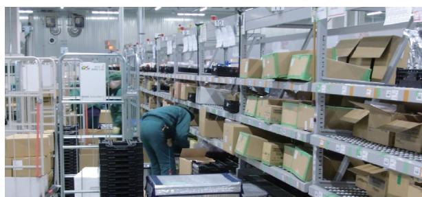
5°に保たれた倉庫内入出荷エリア(商品保管エリアは-25°)