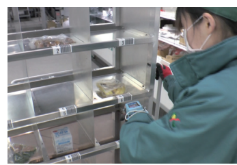
3 カート間口のバーコードをスキャン